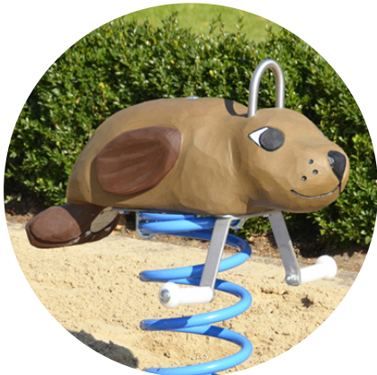
1.10.2.1 »Seelöwe Mads«