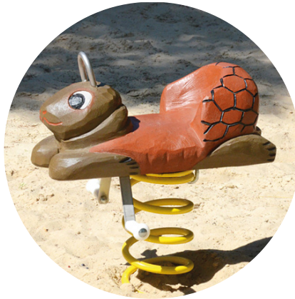
1.23.1 »Schildkröte für Kleinkinder«