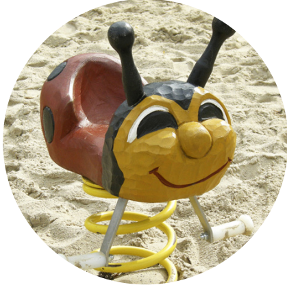
1.8 »Marienkäfer für Kleinkinder«