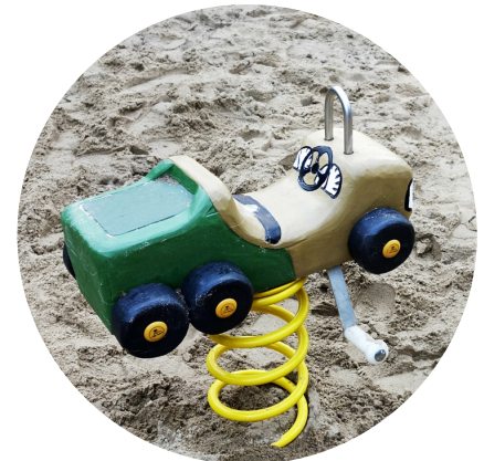
1.29.8 »LKW für Kleinkinder«