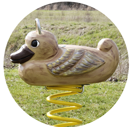
1.24.5.3 «Mallard, female»