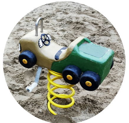
1.29.8 «Truck for toddlers»