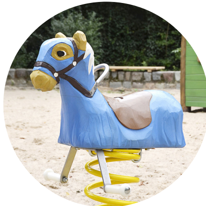
1.20.9 «Jousting horse»