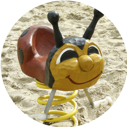
1.8 «Ladybird for toddlers»