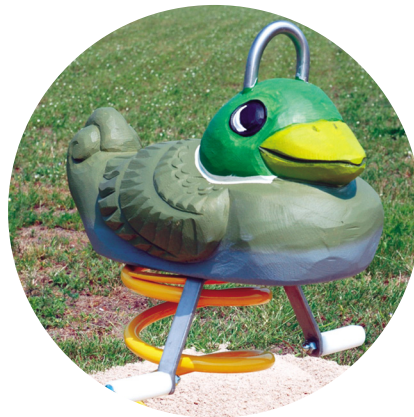
1.24.5 «Mallard, male»