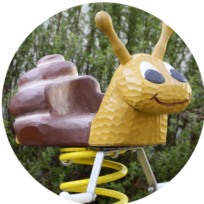
1.3 «Snail for toddlers»