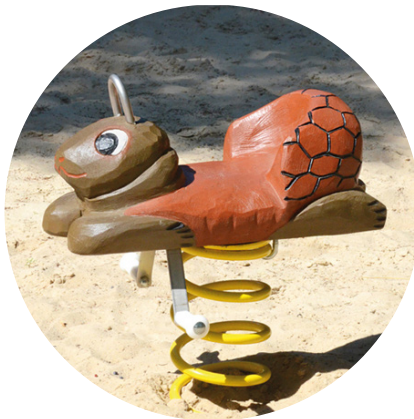
1.23.1 «Tortoise for toddlers»