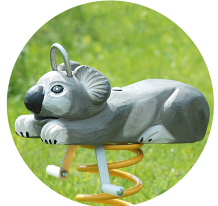
1.93 «Koala bear»