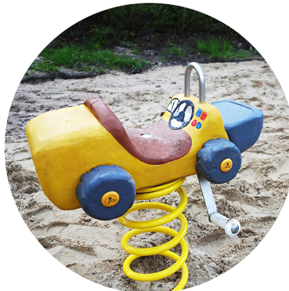
1.29.7 «Wheel loaders for toddlers»