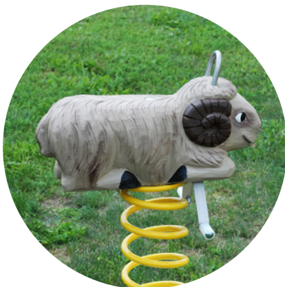
1.28.1 «Sheep, ram»