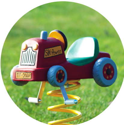
1.29.1 «Tractor for toddlers»