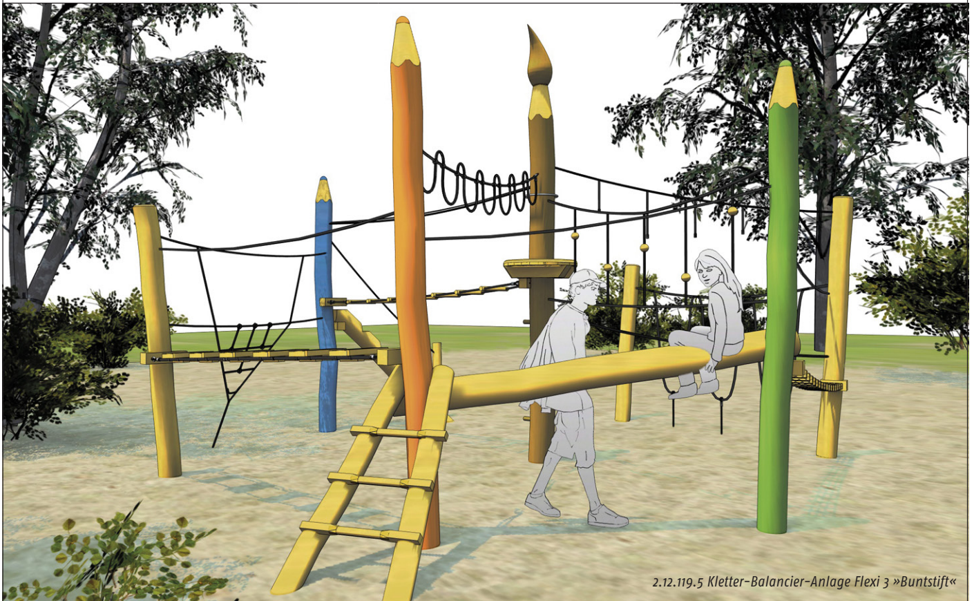
2.12.119.5 Kletter-Balancier-Anlage Flexi 3 »Buntstift«