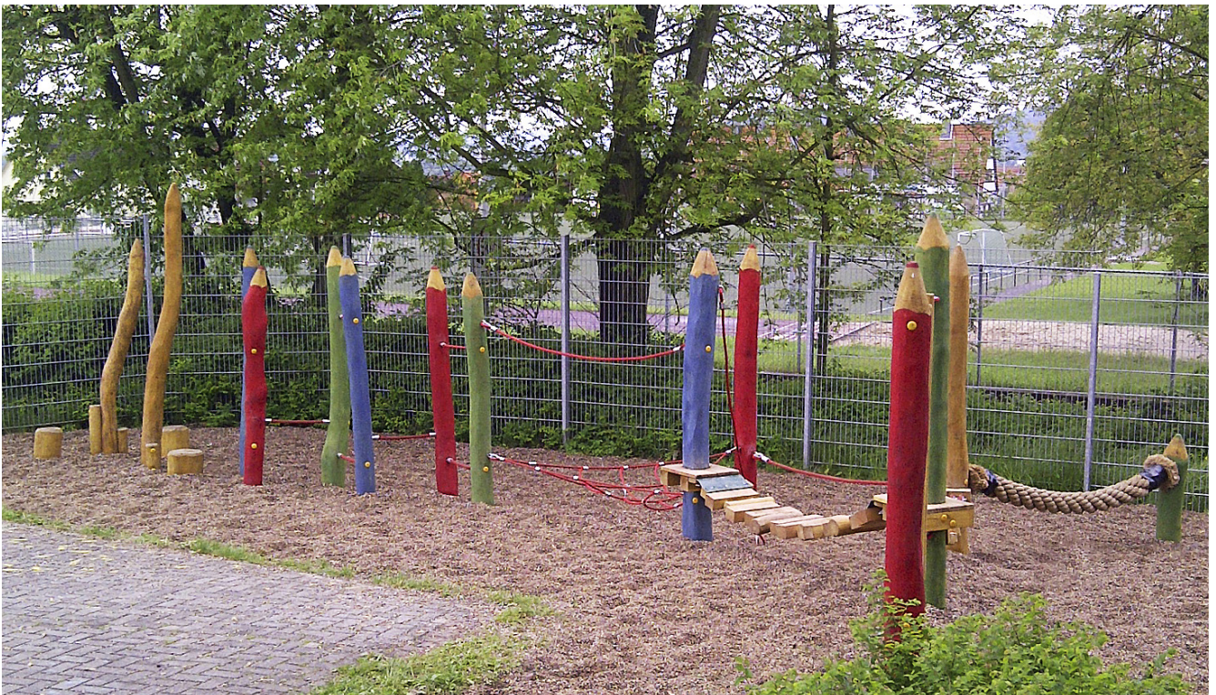
alternativ: 2.15.12.15 Balancierparcours »Buntstifte«