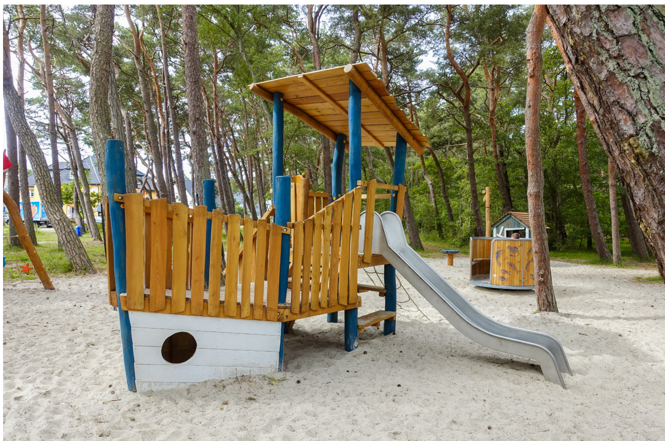
alternativ: 5.37.38 Spielschiff »Kleiner Käpten« farblich gestaltet (ohne Reck)