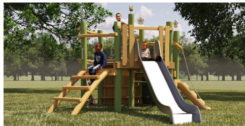
alternativ: 2.8.6.1 Kletterkombination »Bienenwabe« (zzgl. Rutsche, Maltafel, Sitzbank und Rechenspiel)

Durchmesser: ca. 2,8 m Höhe: ca. 2,5 m 7 Pfosten; Ø ca. 15 cm; h ca. 2,5 m 2 Podestfläche 3-eckig ca. 1,4/1,4/1,4 m; Ph = 0,9/1,1m 2 Dreiecksnetze; ca. 1,2/1,2/1,2 m; MW 10/10 cm 2 Schwebende Dreiecke 1 Haltering (Edelstahl); Ø = 0,35 m 1 Baumstammtreppe mit Seilhandlauf; h ca. 1,1 m 1 Knüppelaufstieg; b ca. 1,0 m; h ca. 1,1 m 1 Kletterwand; b ca. 1,4 m; h ca. 1,1 m 3 Pfostenaufsätze »Weiße Blüte« 1 Pfostenaufsatz »Biene« Farbe: Robinie hell / grün Netze: natur