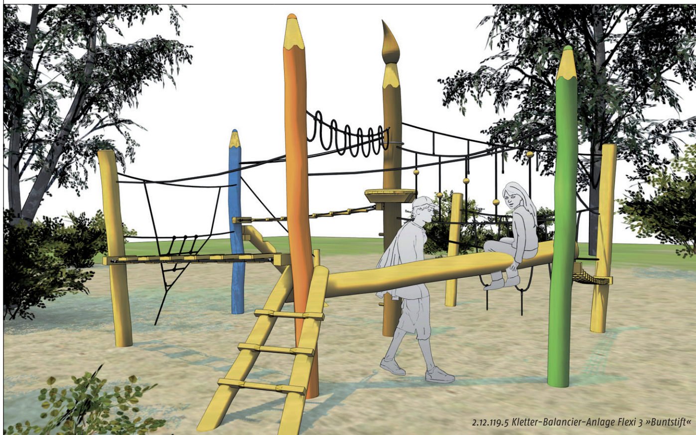
2.12.119.5 Kletter-Balancier-Anlage Flexi 3 »Buntstift«