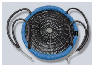
4.3.1.1.3 Minischaukel mit Schaukelkorb (Stahlseilgliedermatte)